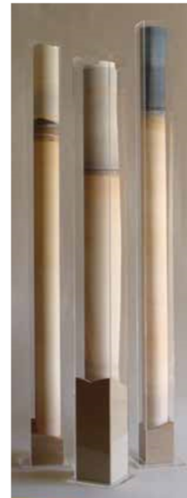
ESTELAS Acuarelas - Metacrilato