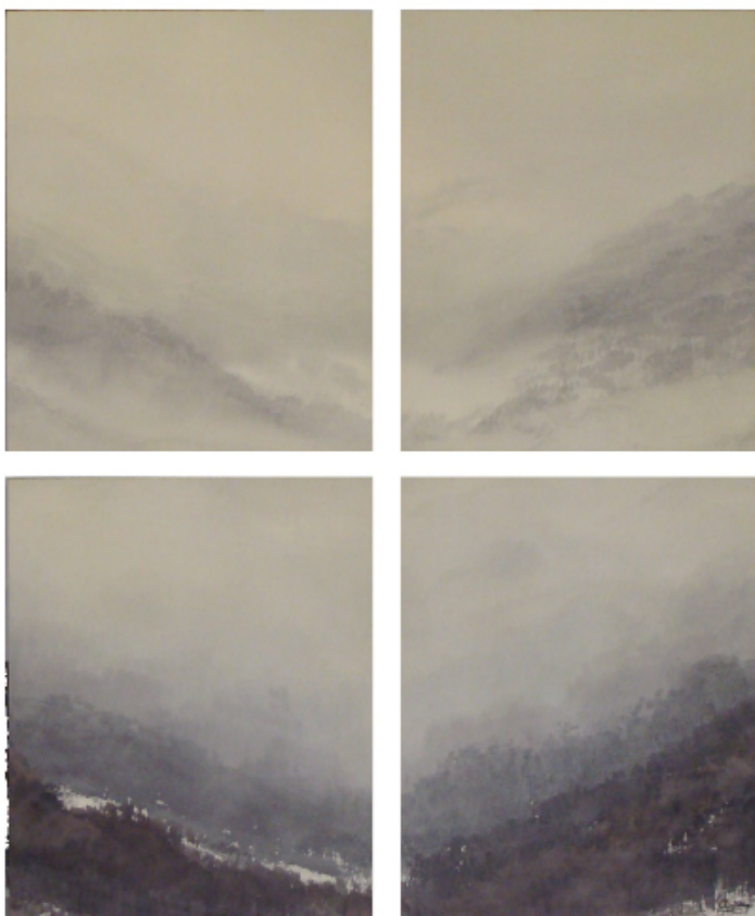
NIEBLAS (POLÍPTICO) 50 x 40 cm ACUARELA