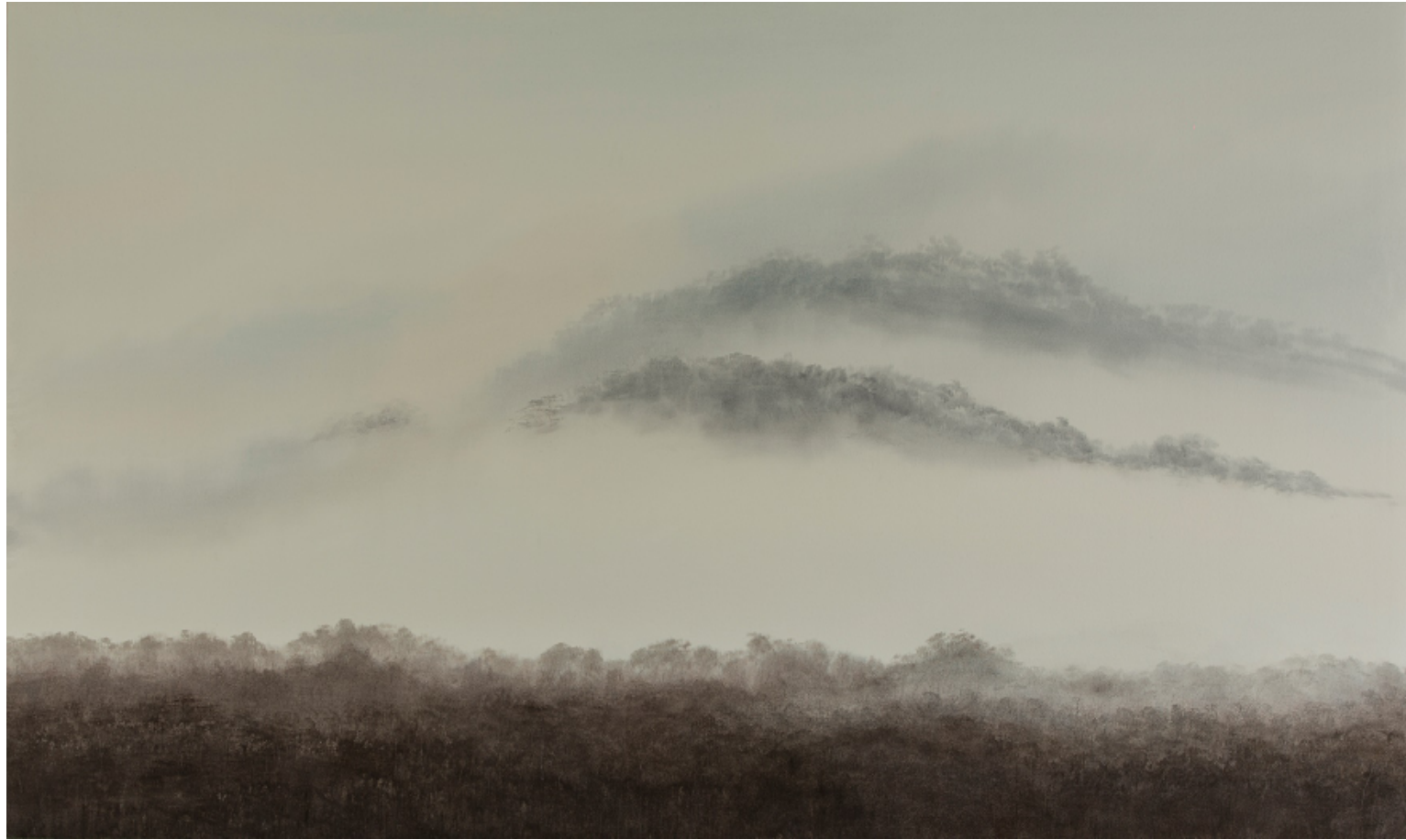
NIEBLAS I 90 x 150 cm ACUARELA