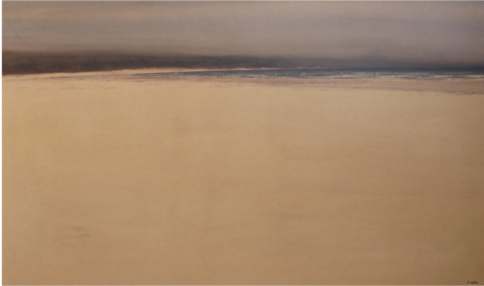
LUGAR PARA EL ENUENTRO 90 x 150 cm ACUARELA