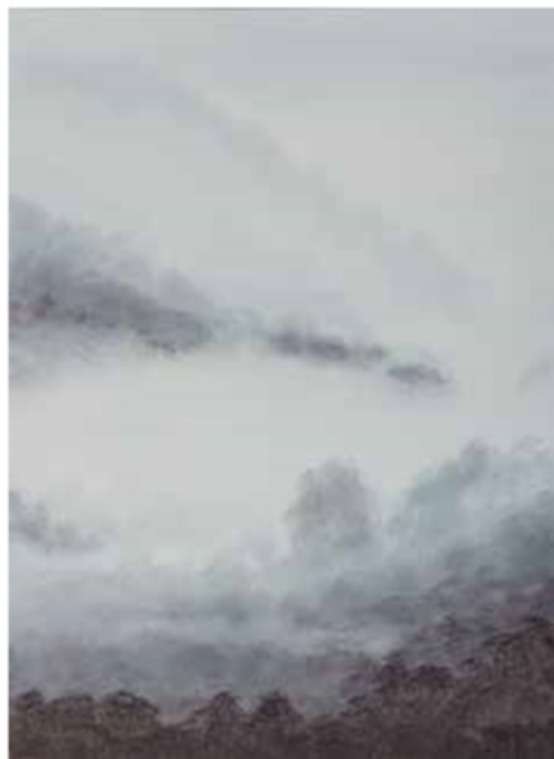
NIEBLAS IV 84 x 62 cm