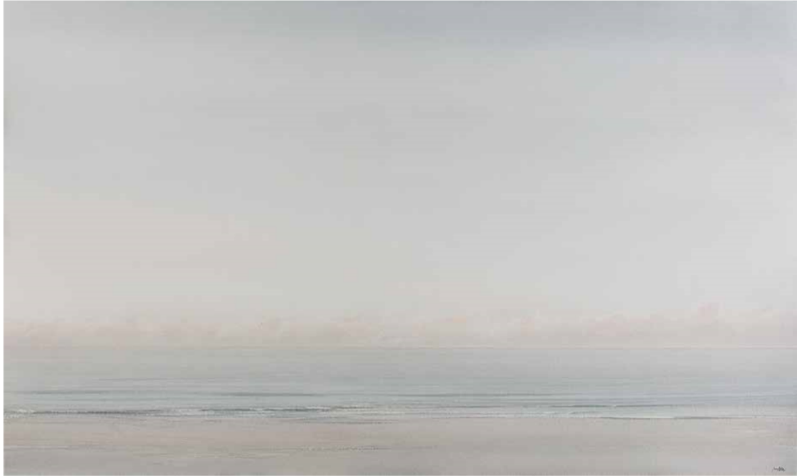
PLAYA Juan Diaz Acuarela 90 x 150 cm