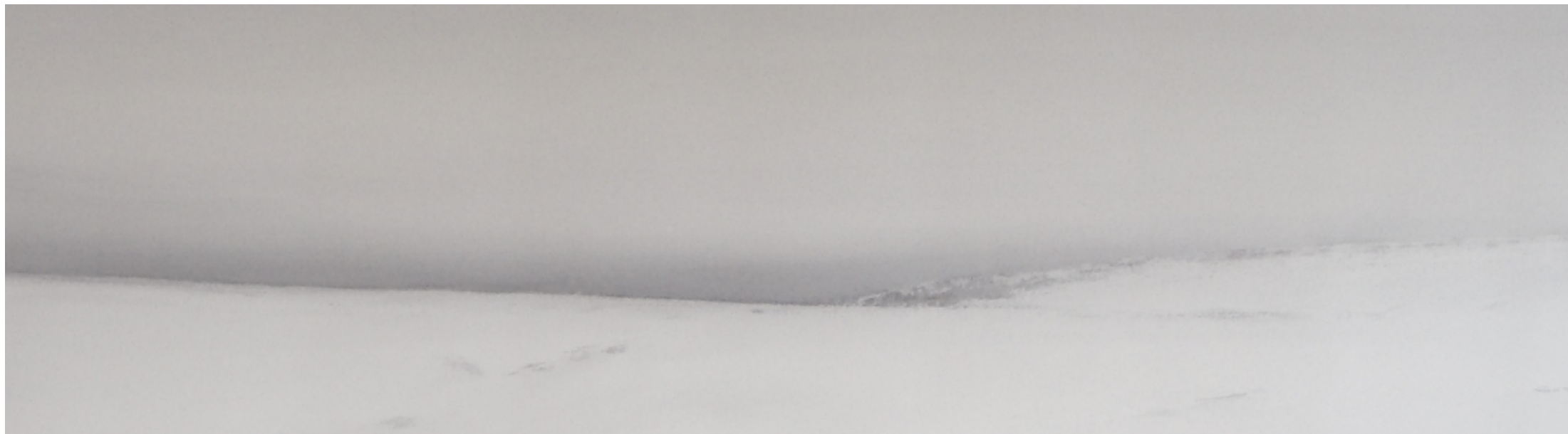
MOMENTOS DE SILENCIO 30 x 100 cm ACUARELA