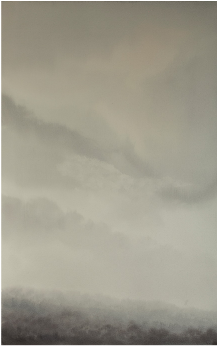
NIEBLAS V 132 x 80 cm ACUARELA