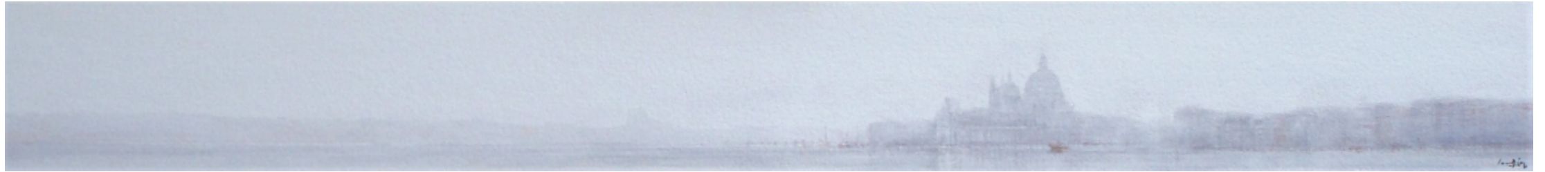
PANORAMICA DE VENECIA (LA SALUTE) 16 x 141 cm ACUARELA