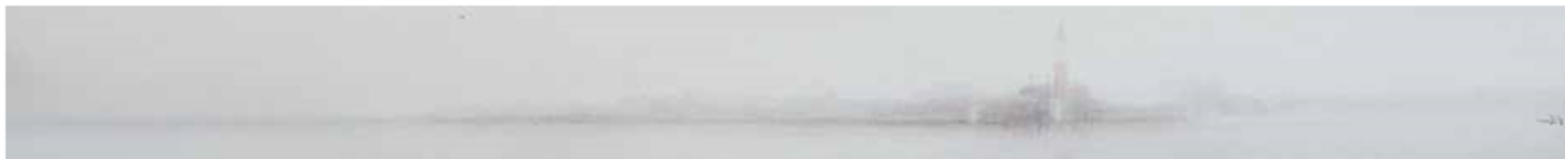
SAN GIORGIO (VENECIA) Juan Díaz Acuarela 16 x 141 cm