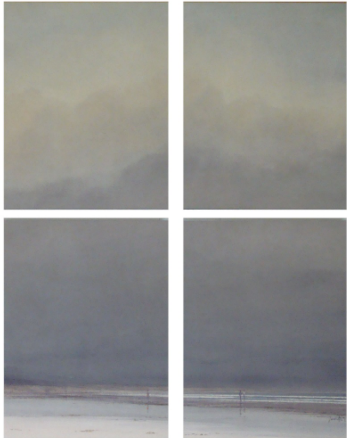
PLAYA EN INVIERNO (POLÍPTICO) 50 x 40 cm ACUARELA