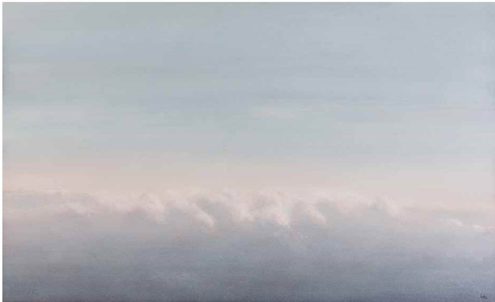
DULCE ABISMO Juan Diaz Acuarela 90 x 150 cm